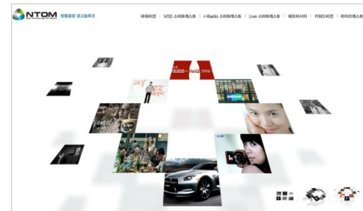
* 엔툼 홈페이지 : www.ntom.co.kr